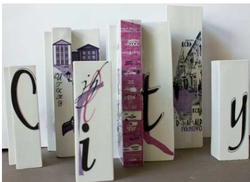
Комплект ваз «Город». Дипломная работа студентки каф. ТКиН