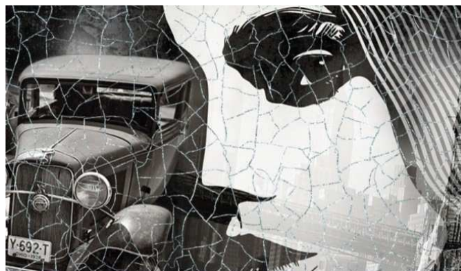
Фресковая живопись на основе гидравлической извести