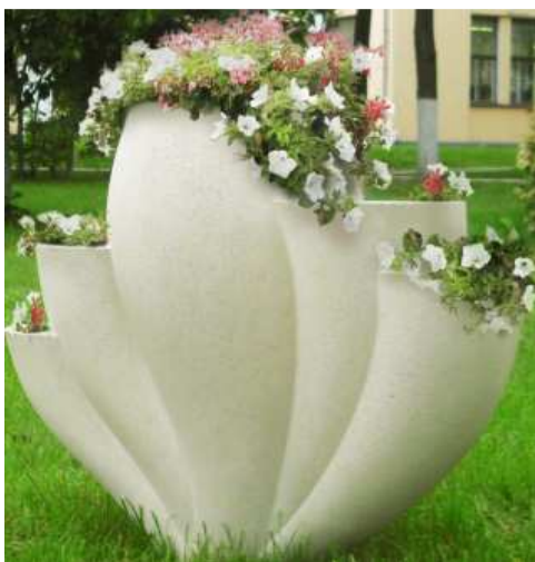
Вазон. Дипломная работа студента каф. ТКиН

Поступайте на нашу кафедру. Творческая атмосфера при обучении, новые знания помогут Вам, в зависимости от Ваших предпочтений, трудоустроиться или на современном предприятии или организовать свой бизнес.