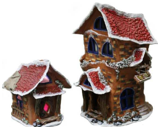
Творческая работа студентки каф. ТКиН